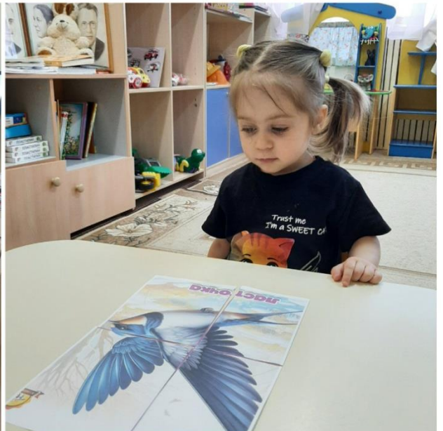
Беседа о птицах и просмотр презентации.