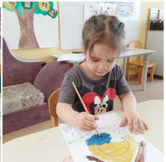
Рисование гуашью «Птица в скворечнике»