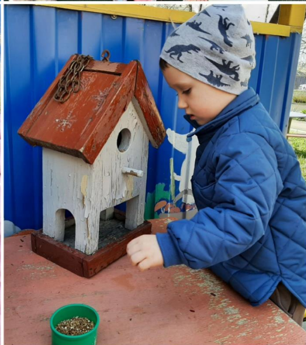
Дети младшей группы 1 и 2 на прогулке насыпают корм птицам.